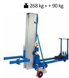
GL850DC 300 kg / 8,7 m