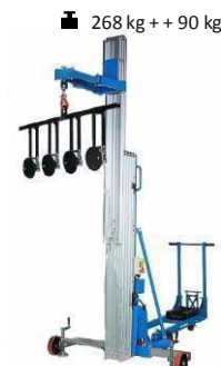
GL855DC + 4H 250 kg / 8,7 m